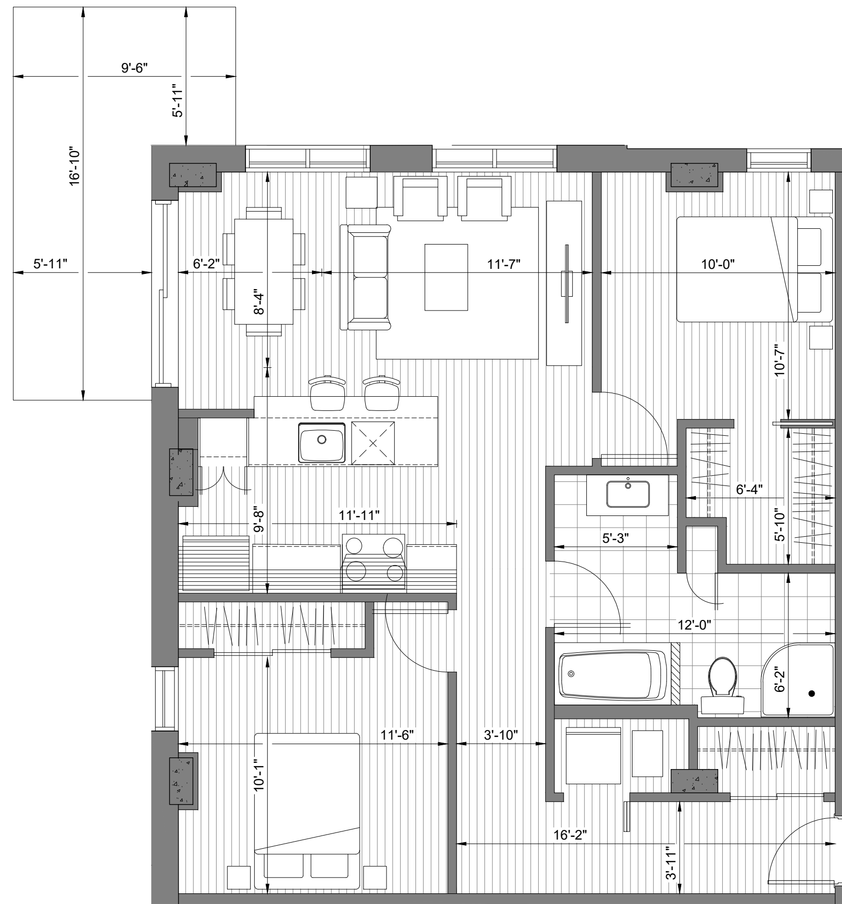
N UNITÉ 4 1/2 ECHELLE: GRAPHIQUE